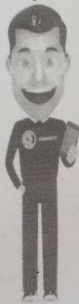
คุยกับพี่ปกป้อง Chatbot พร้อมให้บริการ

ทั้งนี้ ยังมี “พี่ปกป้อง” เป็น chatbot ที่ สคบ. ได้พัฒนาขึ้นมา เพื่อเป็นผู้ช่วยให้คำปรึกษาผู้บริโภค สามารถคอยสอบถามเรื่องด้านธุรกิจ ออกกำลังกาย, ด้านธุรกิจสายการบิน, ด้านธุรกิจโทรศัพท์เคลื่อนที่, ด้านธุรกิจให้เช่าซื้อรถยนต์, ธุรกิจการให้กู้ยืมเงิน, ช่องทางร้องเรียน, ความหมายและติดต่อหน่วยงาน, ด้านฉลาก, ด้านโฆษณา, ด้านหมู่บ้านจัดสรร, ด้านธุรกิจประกันภัย, ด้านธุรกิจบัตรเครดิต, ด้านธุรกิจขายอาคารชุด, ด้านธุรกิจการให้เช่าที่อยู่อาศัย